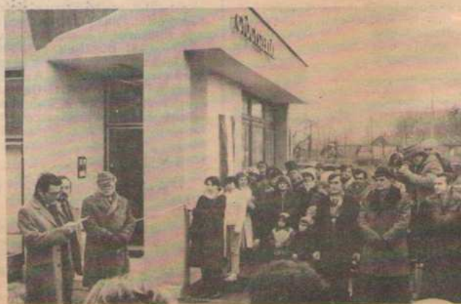
Mándoki István avatta fel Tiszavasvári új egészségügyi komplexumát.