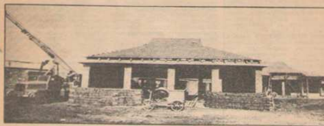
Két esztendője nagy család érte Tiszavasvári lakóit: a megépült városi címet nem kapták meg, nem keserűség, azonban el, a korábbi még dinamikusabb fejlődést tempót kezdtek diktálni. A nagyközségi vezetői és lakói megértették a városi feltevéleket itt, maguknak kell megteremtük.

Nagy lendületet adott az elmúlt évben elnyert városi jogú nagyközségi cím. A várossá válás kézzelfogható közzéte örök energiát szabaddított fel. A VI. ötéves tervben eddig 87 millió forint értékű társadalmi munkát végeztek a nagyközségi lakói. Kiemelt feladat volt a gáz-hálózat az új iskola és óvoda építése. Benzinkút, szolgáltatóüzemek, gyógysz-