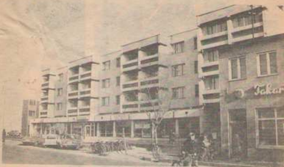
Tűzbiztos házak Tiszavasváriban.

Tiszavasvári két önálló községből létesült. Evszázadokon keresztül külön életet élt a két falu: Szentmihály és Bög. A település első okleveleiből emlékszik 1282-ből való. A lakók a Tisza folyó árterületéről sokat szenvedtek, melyekben felváltva német és magyar a folyó árterületé váltak.