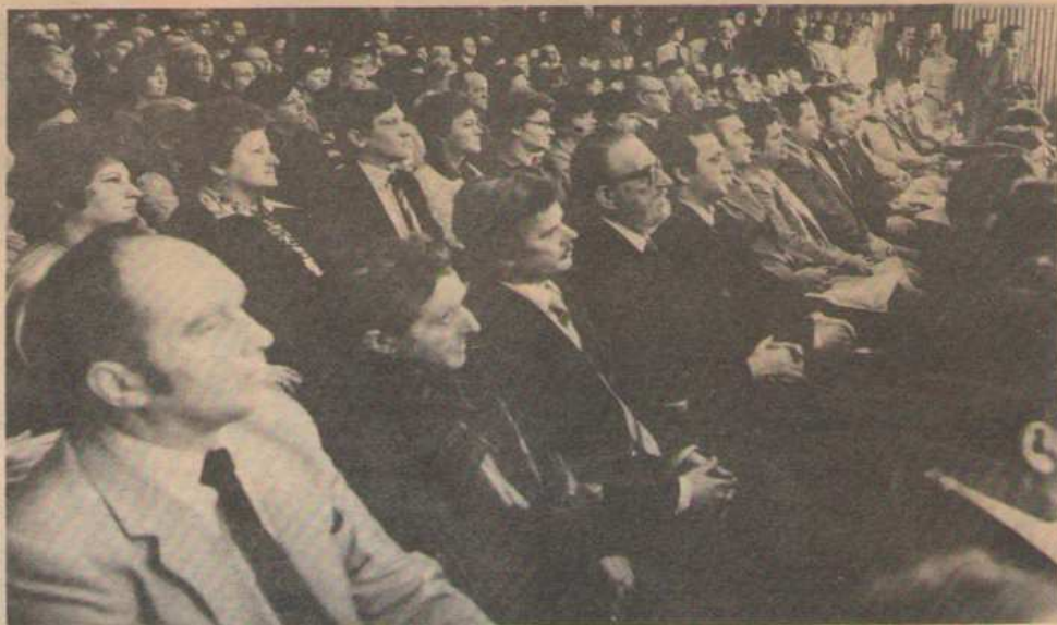
A Tiszavasvári Városi Tanács tagjainak egy csoportja.

Tiszavasvári város tanácselnöke meghatódottan és örömmel vette át a városi státust tanúsító oklevelet, majd rövid beszédben vázolta a küzdelmes évszázadokat, az utóbbi évtizedek törekvéseit a városi cím elnyeréséért. Többek között válaszolt arra a kérdésre is: város-e már valójában Tiszavasvári? Megkaptuk a városi címet, de úgy vagyunk ezzel, mint az új családi házával van az ember — mondta —, ha már kész, megkapja a lakhatási engedélyt, de hiánypótlási kötelezettséggel. Itt a városban is jócskán van még pótolni, csinosítani való; egyének és munkakollektívák értéktelmeztető társadalmi munkájá-