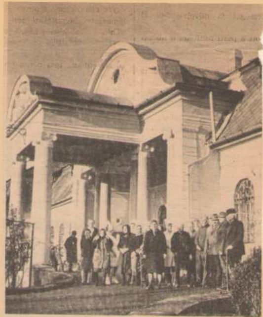
A régi kastély ma szociális otthon

Az új esztendő első napjától tizenhat új város kerül hazánk térképére. (A városhálózat bővüléséről szóló írásunk lapunk 4. oldalán olvasható.)